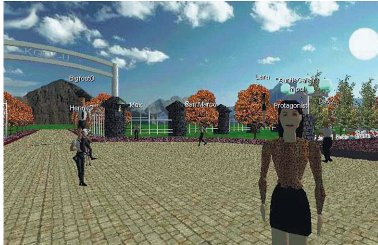
Figuur 2: Een bijeenkomst van avatars in AlphaWorld